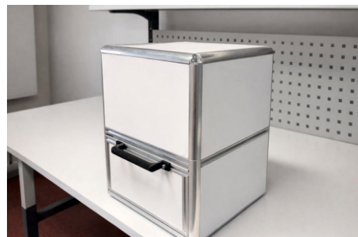
Внешний вид портативного гиперспектрального комплекса