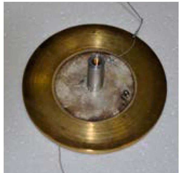
Макет биморфного пьезопреобразователя